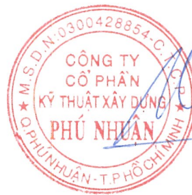
DƯƠNG DŨNG NHÂN