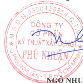
NGÔ NHƯ HÙNG