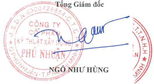
NGÔ NHƯ HÙNG